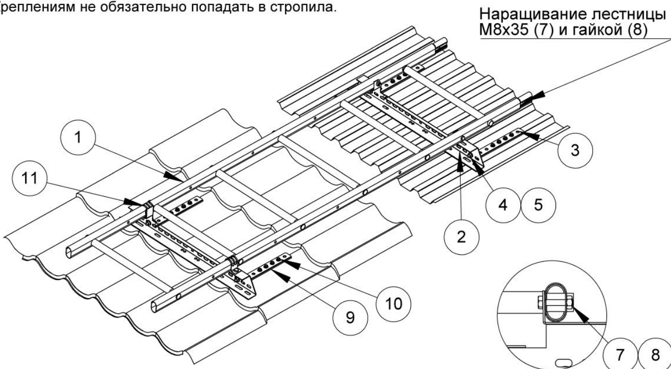
Крепление лестницы к балке-помосту